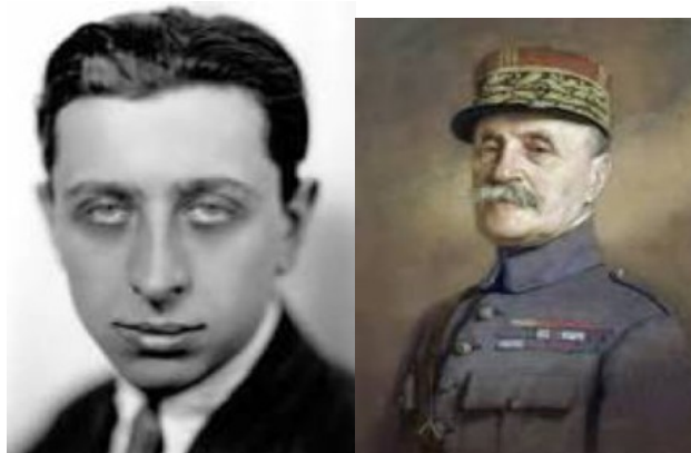
Robert Desnos et Ferdinand Foch