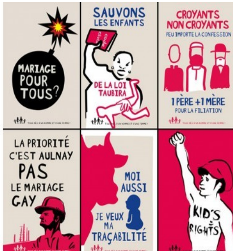
Affiches de la Manif pour tous (Manif pour tous)