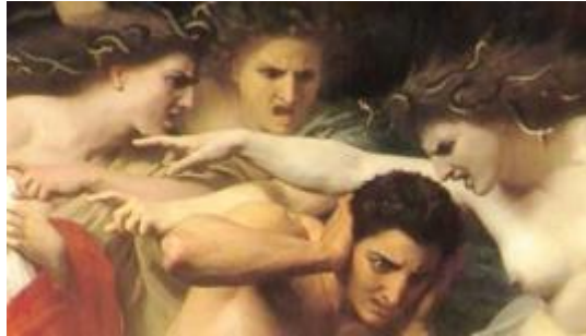
Les Erinyes pourchassant Oreste après le meurtre de sa mère

L'au-delà de l'Œdipe prend ainsi la voie d'un retour irrésistible des figures archaïques, de Chronos, Ouranos et Zeus ou de l'ancêtre de Totem et Tabou , comme de la mère perdue et de ses représentations antiques : figures de divinités chtoniennes et puissance des Erinyes.